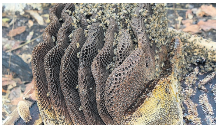
Récolte de miel de la région d'Inyonga, en Tanzanie.

E n 2001, les Wakonongos ont demandé un appui technique en apiculture. Cette communauté de la région d'Inyonga, en Tanzanie, pratique cette activité traditionnelle à large échelle. «Les Wakonongos utilisaient l'écorce des arbres pour faire leurs ruches et ne laissaient pas de miel aux colonies d'abeilles, ce qui n'était pas durable. Leurs pratiques ne correspondaient plus aux lois et créaient des conflits avec les autorités chargées de la gestion de l'environnement. Cela affaiblissait leur position dans les négociations avec l'Etat pour obtenir plus de droits sur les forêts de leurs ancêtres», explique Sandy Mermod, secrétaire exécutive de l'Association pour le développement des aires protégées (ADAP).