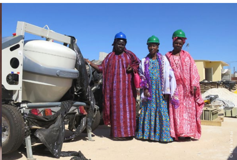
Des bénéficiaires du projet d'urbaMonde dans la banlieue de Dakar. Les partenaires locaux, urbaSEN et la Fédération Sénégalaise des Habitant-e-s, ont reçu le Prix mondial de l'habitat.