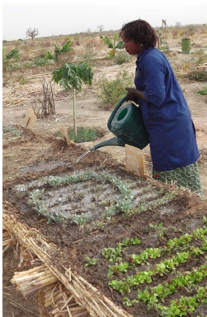
Un projet d'agroécologie de Tourism for Help au Mali.