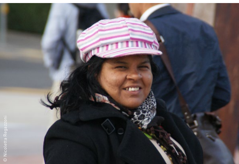
Sônia Guajajara à Genève pour le 50 e anniversaire du MCI en 2012. Partenaire de l'ONG, elle vient d'être nommée ministre des peuples indigènes au Brésil.