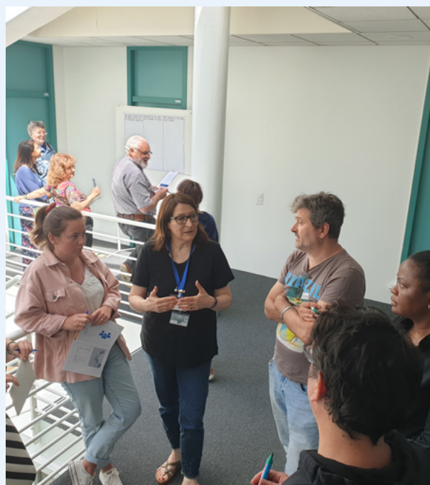
Discussion sur les objectifs liés à l'information et à la sensibilisation du public lors de la journée de travail avec les OM.

Le document est préparé par les secrétaires généraux