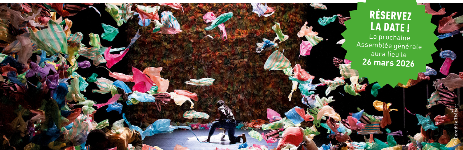
La pièce Mer plastique créée au Théâtre du Grütli en décembre 2022 par le chorégraphe Tidiani N'Diaye, qui collabore avec la FGC pour les festivités du 60°.

La prochaine Assemblée générale aura lieu le 26 mars 2026