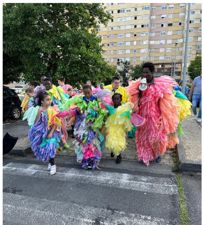
La Parade défile dans la région parisienne.