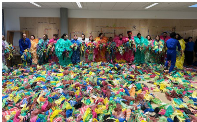
Atelier de préparation de la Parade .